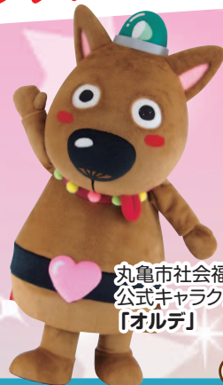
丸亀市社会福祉協議会 公式キャラクター 「オルデ」