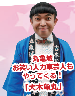
丸亀城 吉本 大木亀丸 お笑い人力車芸人も やってくる! 「大木亀丸」