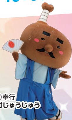
とり奉行 骨付じゅうじゅう