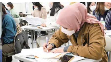
かえ くり返し勉強できる