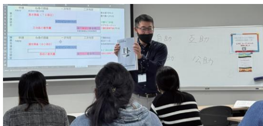
がくしゆ 学習ポイントがわかる