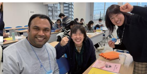
なかま 仲間ができる